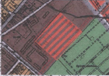
WYRYS ZE STUDIUM UWARUNKOWAŃ I KIERUNKÓW ZAGOSPODAROWANIA PRZESTRZENNEGO MIASTA KOŚCIANIE SKALA 1:500